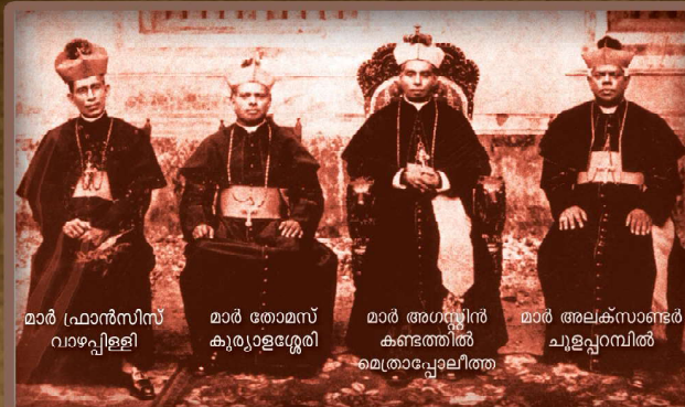
സീറോമലബാർ ഹയരാർക്കിയിലെ പ്രഥമ അംഗങ്ങൾ