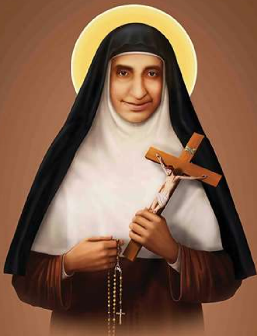
ST. EUPHRASIA ELUVATHINGAL 1877 - 1952